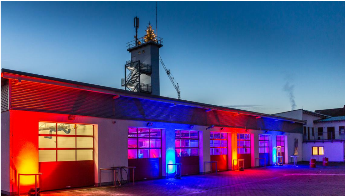
Die Feuerwache in ganz neuem Licht kam bei den Gästen gut an

Der Landkreis richtete eine Dankeschön-Party für das ehrenamtliche Engagement von Feuerwehren und Katastrophenschutz-Einheiten während der Hochphase des Flüchtlings-Zustroms in den vergangenen Jahren aus.