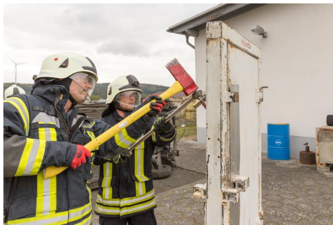
Ein Vorhängeschloss ist kein ernst zu nehmender Gegner...

Am Ende des Seminars hatten alle Teilnehmer neue Kniffe und Tricks gelernt, um das Werkzeug künftig noch zielgerichteter und wirksamer einsetzen zu können. hvs