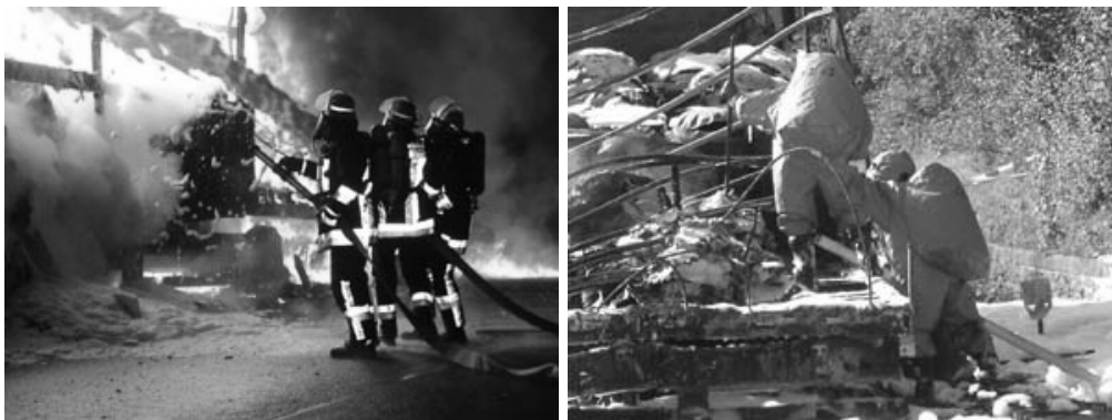
Das Bild links zeigt u. a. den Elzer Angriffstrupp beim Löscheinsatz im „heißen Bereich“. Das rechte Bild zeigt Sicherungsarbeiten unter „Vollschutz“ mit Chemikalien-Schutzanzügen.