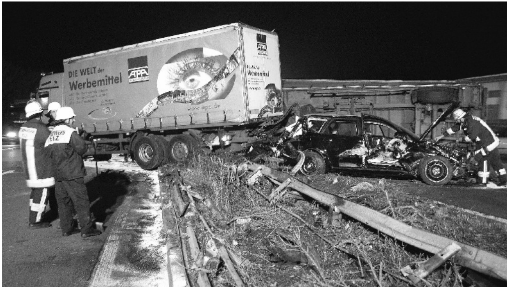
Blick auf die Unfallstelle. Rechts im Hintergrund der umgestürzte Lkw-Anhänger